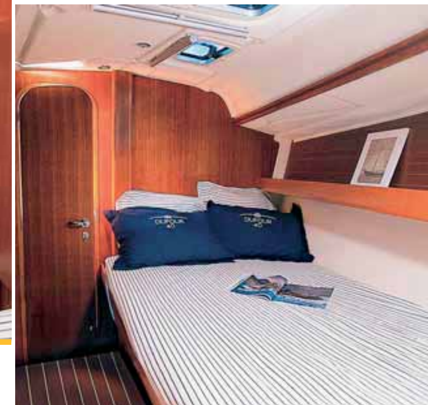
Gli interni sono stati prevalentemente realizzati con arredi in legno Moabi. A sinistra, un pratico armadio; sotto, la cabina armatoriale posta in zona prodiera, dotata di letto a murata

L'impiantistica è stata studiata, così come deve essere, all'insegna della semplicità e dell'accessibilità, con tutte le prese a mare concentrate in bagno e un quadro elettrico ben fatto (con indicatori di livello per acqua e gasolio, ma senza amperometro). Limitata anche la capacità delle batterie, due da 100 Ah, con l'eventuale seconda per i servizi inserita nella lista degli optional.