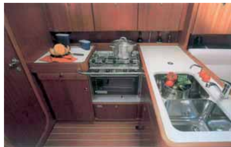
Sopra, la cucina a L, attrezzata con un lavello a due vasche, un fornello con forno basculante, numerosi stipetti e cassetti per riporre gli alimenti. Vivibile e ben organizzata negli spazi, è posta di fronte all'ampia zona dedicata al carteggio

La dinette, composta da due divani a murata tra i quali è posto un tavolo a semipiani abbattibili, si presenta sufficientemente grande per ospitare fino a 8 persone e ben proporzionata con il resto del quadrato. A sinistra troviamo la cucina, di forma a L, completa di lavello a due vasche, fornello con forno basculante e numerosi e capienti stipetti e cassetti per stivare la cambusa. Di fronte l'ampia zona dedicata al carteggio.